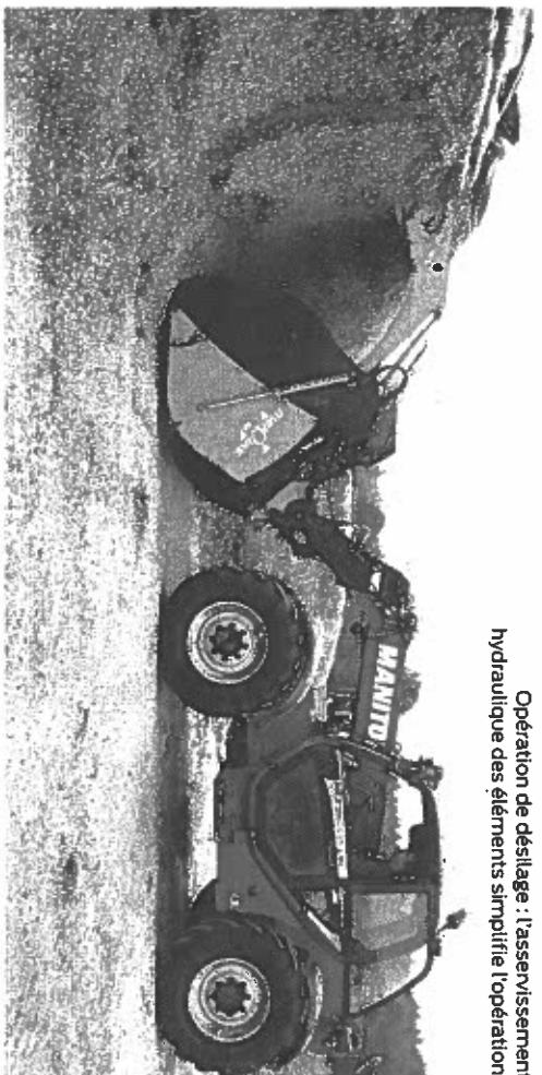
Opération de désilage : l'asservissement hydraulique des éléments simplifie l'opération.

LAIT Pourquoi faire compliqué quand on peut faire simple. À Locunolé (29), Michel Pensec reste un adepte de la distribution au godet. Pour alimenter son troupeau de 60 laitières, il s'est équipé d'un godet désilateur-mélangeur-distributeur monté sur télescopique. En choisissant un volume de 4,60 m 3 , deux allers-retours silo-stabulation suffisent pour remplir l'auge des vaches. « Je réalise deux distributions quotidiennes. Ainsi, le soir, j'ai juste les volumes à la quantité consommée dans la journée »