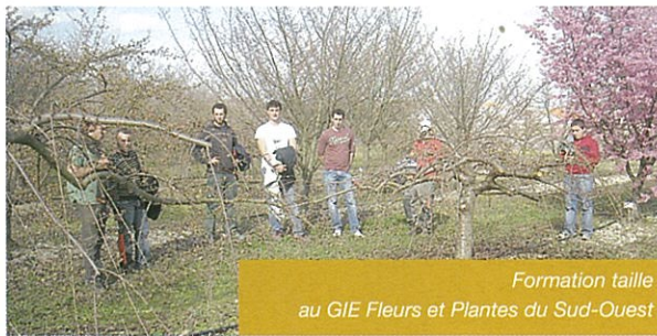
Formation taille au GIE Fleurs et Plantes du Sud-Ouest

Vous avez été nombreux à vous inscrire à la formation Taille des arbustes et des fruitiers qui a eu lieu en mars au GIE Fleurs et Plantes du Sud-Ouest. L'aspect «travaux pratiques» de la formation a été très apprécié des participants. Le nombre de places étant limité, certaines entreprises n'ont pu y participer, une nouvelle session leur sera proposée les 8 et 9 décembre.