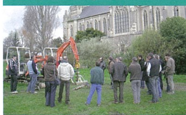
Les paysagistes des Côtes-d'Armor, acteurs de l'optimisation du matériel

Le 25 février dernier, à l'école d'horticulture de Saint-Illan, Pierrick Hervé, président départemental 22 et de nombreux adhérents ont assisté à une démonstration de matériels pouvant s'adapter à divers outils de chantier utilisés au quotidien pour la création et l'entretien des jardins. La démonstration a été réalisée par l'entreprise Arzel, avec les outils Klac. En fin de réunion, les paysagistes présents ont pu échanger sur la réglementation en matière de contrôle des matériels.