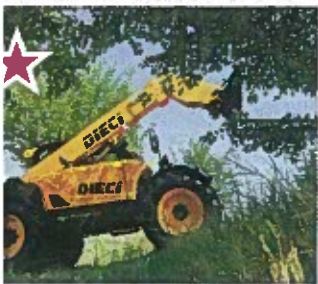
France : 10 - Allée J - Stand 24

Cette technique de fabrication d'aliment d'allaitement combine spray (ré-engraissement sous forme liquide), et sprüh (ré-engraissement solide) pour une meilleure solubilité du lait, facilité dans les Dal et digestion de la matière grasse pour les veaux... Le produit est plus stable aux variations de températures pour ne pas fondre et prendre en été ou être trop fluide dans les Dal en hiver.