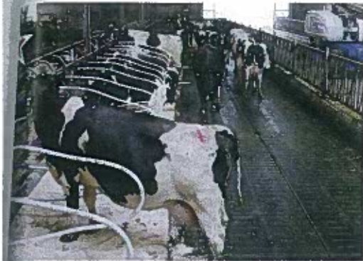
EX : 13 - Allée D - Stand 45