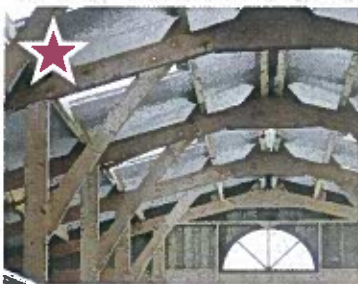
ETERNIT : Hall 2-3 - Allée F - Stand 72

Adaptable sur chariot télescopique, chargeur tracteur et relevage avant, ce produit andain tout type de déchets. Sa particularité réside dans l'absence de roues, permettant ainsi au balai de suivre parfaitement les irrégularités du sol à l'aide d'un pilotage hydraulique, sans aucune intervention du chauffeur. L'usure du balai, automatiquement compensée, ne nécessite aucune intervention.