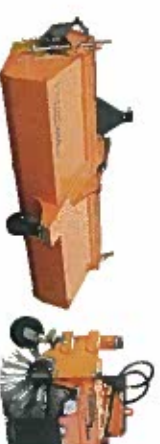
Bema Kommunal 600 Dual