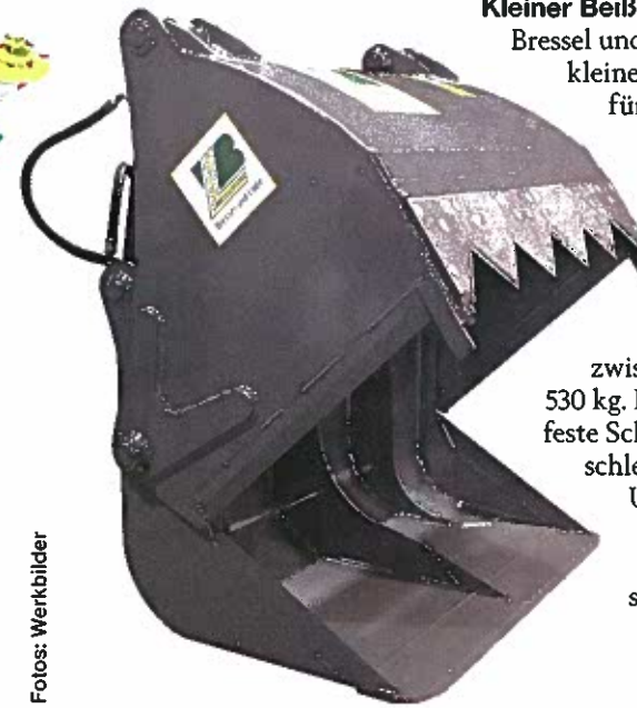
Halle 27, Stand A 41

Kleiner Beißer: Neu von Bressel und Lade ist die kleine Schneidschaufel für kleine Schlepper und Hoflader. Es gibt drei Modelle mit 400, 490 und 580 l Inhalt. Das Leergewicht liegt zwischen 450 und 530 kg. Die verschleißfeste Schürfkante, Verschleißstreifen an der Unterseite und zwei Hydraulikzylinder sind serienmäßig.