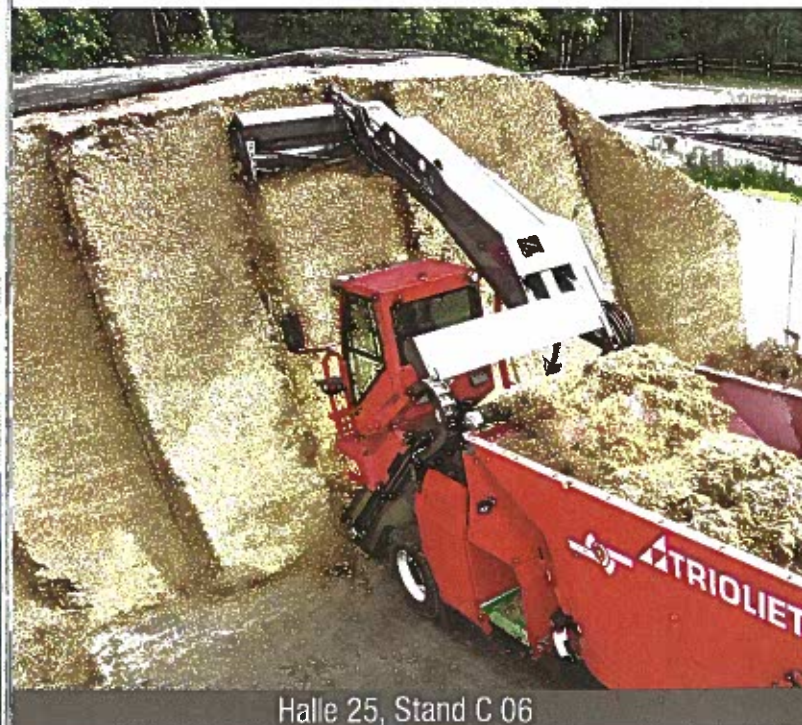
Halle 25, Stand C 06

Mit Teleskop: Trioliet zeigt den Selbstfahrer Triotrac als „New Edition“. Interessant ist das Entnahmesystem mit integriertem Teleskop. Damit sind Höhen von bis zu 6 m ohne Hohlschnitt möglich. Die Entnahmebreite beträgt 1,85 m.